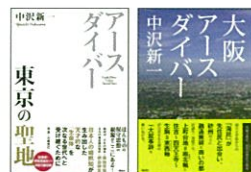
左: アースダイバー 東京の聖地