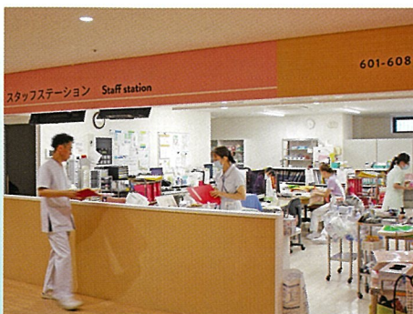
■スタッフステーション

敷地内へは深い軒が歩行者をお出迎え。優しい表情の木の屋根が入口まで伸び、屋内へと続く木の天井は、日本の伝統家屋のような佇まいを醸します。